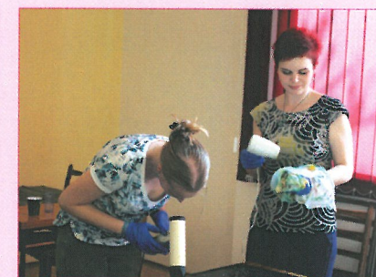
Výroba dáreků do dobročinného prodeje