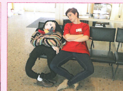
Dobrovolnice na Psychiatrické klinice