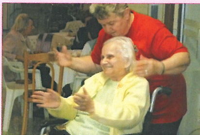
Dobrovolnice v Domově pro seniory