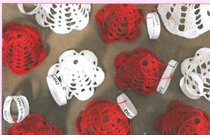
Výrobky dobrovolníků - vánoce