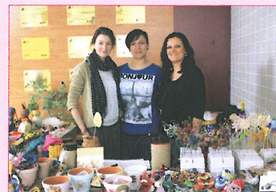
Předvelikonoční dobročinný prodej

Jako již tradičně, i v roce 2014 uspořádalo Dobrovolnické centrum Motýlek setkání u příležitosti Mezinárodního dne dobrovolníků. Motýlek tak společně s Fakultní nemocnicí Brno vyjadřuje touto formou poděkování za odvedenou celoroční práci. Dobrovolníci tuto příležitost vzájemného setkávání v předvánočním čase velmi vítají a využívají jí především k vzájemné výměně zkušeností a zážitků ze své dobrovolnické činnosti. Symbolické ocenění a malé občerstvení pak jen přispívají k celkové atmosféře setkání.