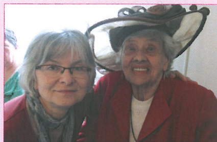
Dobrovolnice v Domově pro seniory

Z celkového počtu 210 registrovaných dobrovolníků se v průběhu roku do činnosti skutečně aktivně zapojilo 105 osob, 4 uchazeči nevyhovující nárokům dobrovolnické služby byli odmítnuti koordinátorkou, 37 dobrovolníků svou činnost v loňském roce ukončilo. K 31. 12. 2014 zůstává registrováno 144 dobrovolníků.