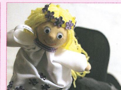
Panenko z dobročinného prodeje