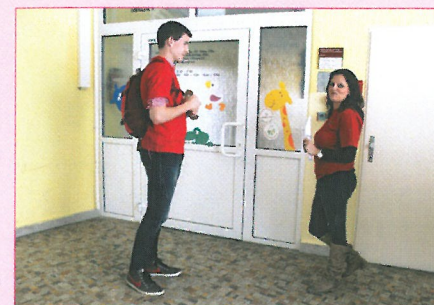
Uvedení nováčka na oddělení