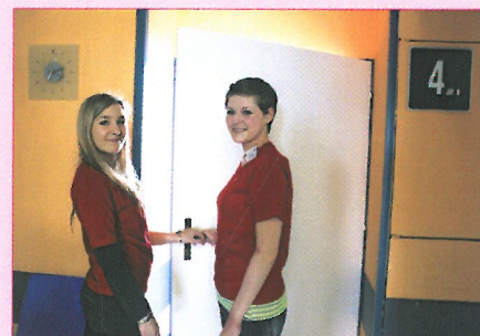
Dobrovolnice na neurochirurgické klinice