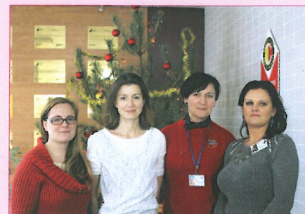
Dobrovolnice při předvánočním prodeji