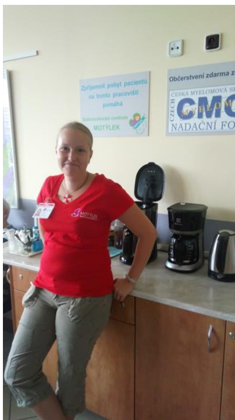
Dobrovolnice na ambulanci IHOK připravují občerstvení pacientům

Píši svým jménem za celou ambulanci Interní hematoonkologické kliniky.