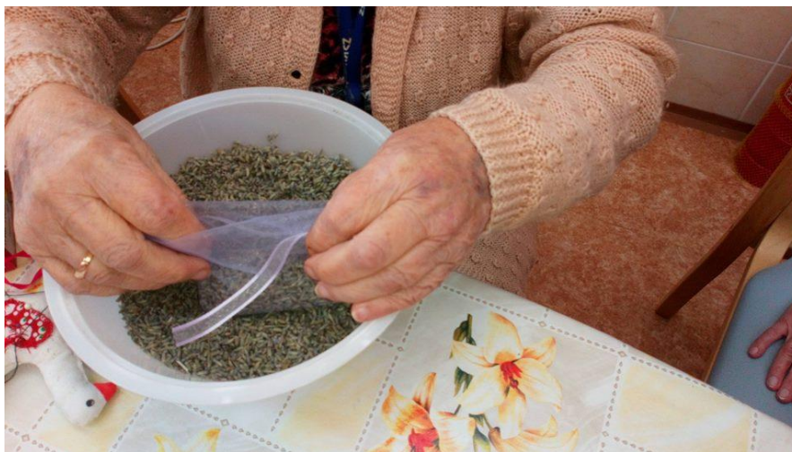
Tvoření klientů domova pro seniory

Poslední jmenovaná vlastnost je také důležitá pro dobrovolníka působícího na odděleních pro dospělé pacienty. Kromě toho by měl mít nutnou dávku empatie a schopnost vcítit se do kůže pacienta, jen tak mu pak může adekvátním způsobem zpříjemnit chvíle v nemocnici. Nelze opomenout na dobrovolníky působící v domovech pro seniory. Píle a ochota, která je jimi vkládána do této práce je jim odměňována právě velkou vděčností, kterou senioři projevují. Dobrovolník je pro ně často příjemnou alternativou trávení volného času.