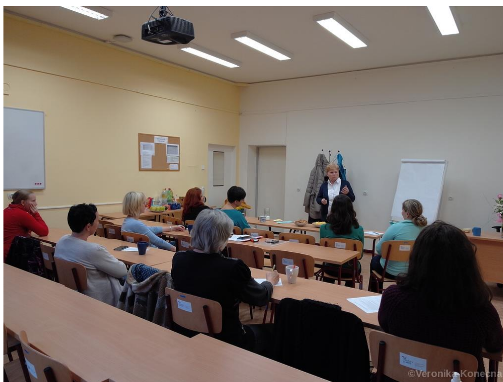
Seminář pro dobrovolníky „Neverbální komunikace“