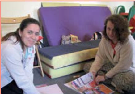
Nové uchazečky o dobrovolnění