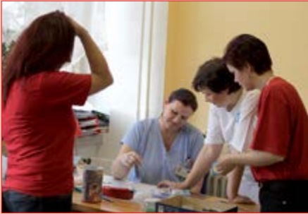
Spolupráce se sestrami je důležitá