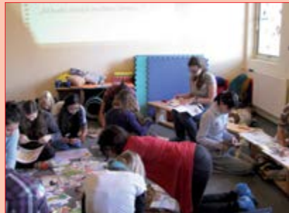
Vstupní školení dobrovolníků