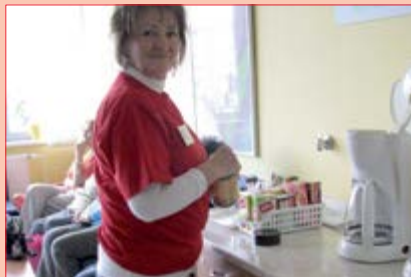
Příprava občerstvení pro pacienty ambulance

Chtěli bychom touto cestou poděkovat všem dobrovolníkům, kteří věnovali svůj volný čas našim uživatelům. Doufáme, že spolupráce mezi DC Motýlek a DS Koniklecová bude i nadále pokračovat.