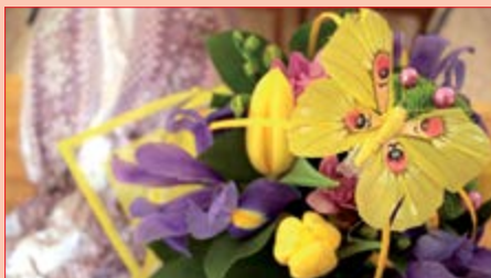
Motýlek - symbol našeho DC