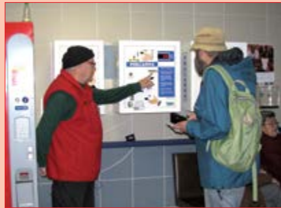
Informační služba v ambulancích