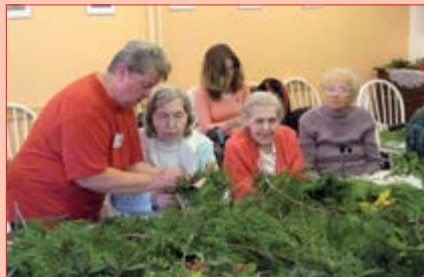
Vázání věnců na Koniklecové