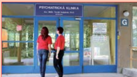
Psychiatrická klinika je jednou z dobrovolničky oblíbených klinik