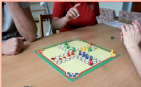
Častá aktivita dobrovolníků s pacienty